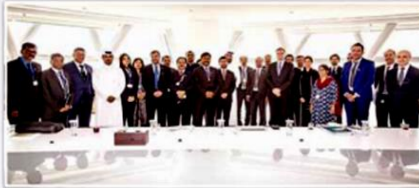
وقد بحثت شركات الهندسة المشاركة في مشاريع كأس العالم 2022

ممتنون لحكومة وشعب قطر على دعمهم المستمر للجانالية الهندية