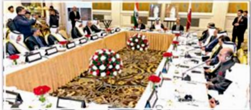
رئيس الوزراء خلال الاجتماع مع عدد من رجال الأعمال في الهند - أرشيفية